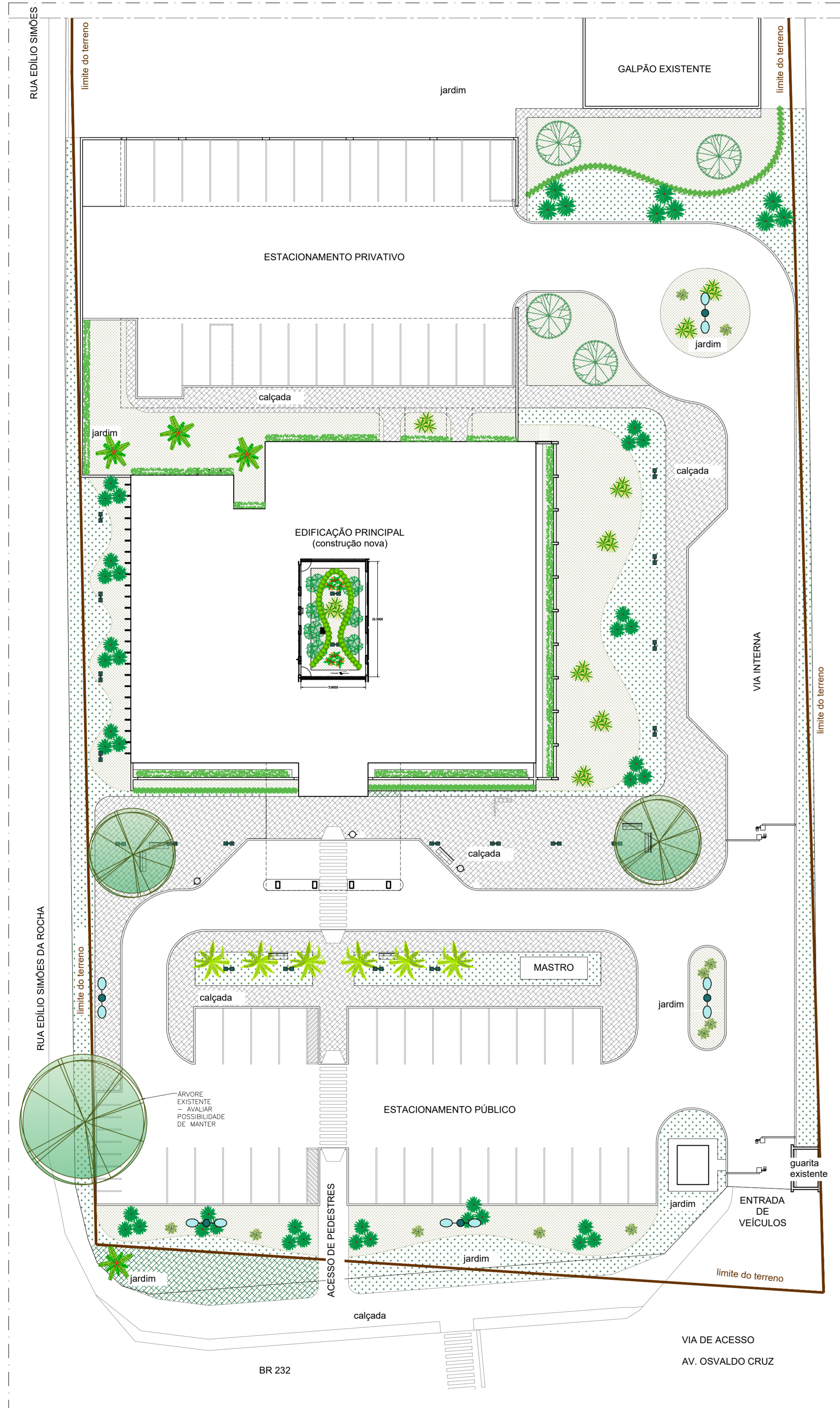
PLANTA DE PAISAGISMO ESC.: 1:250